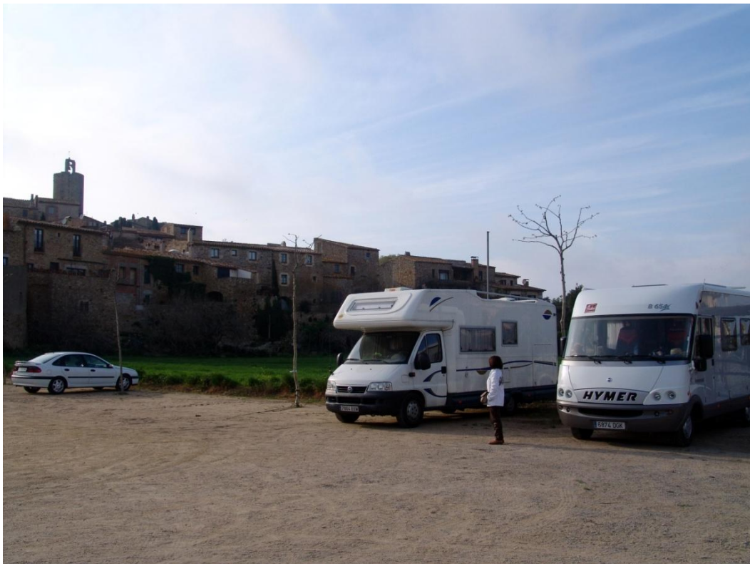
(Parking de Pals) 41° 58' 15" N - 3° 08' 47" E

Como se había hecho tarde, decidimos quedarnos a dormir en el mismo parking, nosotros ya hemos pernoctado varias veces y siempre hemos estado muy bien y muy tranquilos.