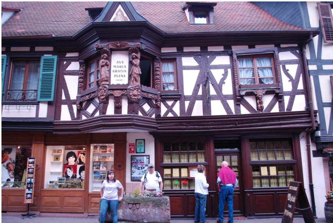
Ribeauville, La Pfifferhüss

Sinn es una de las que más encanto tienen, está repleta de casas típicas alsacianas con una fuente en el centro donde hay una estatua de André Fridrich.