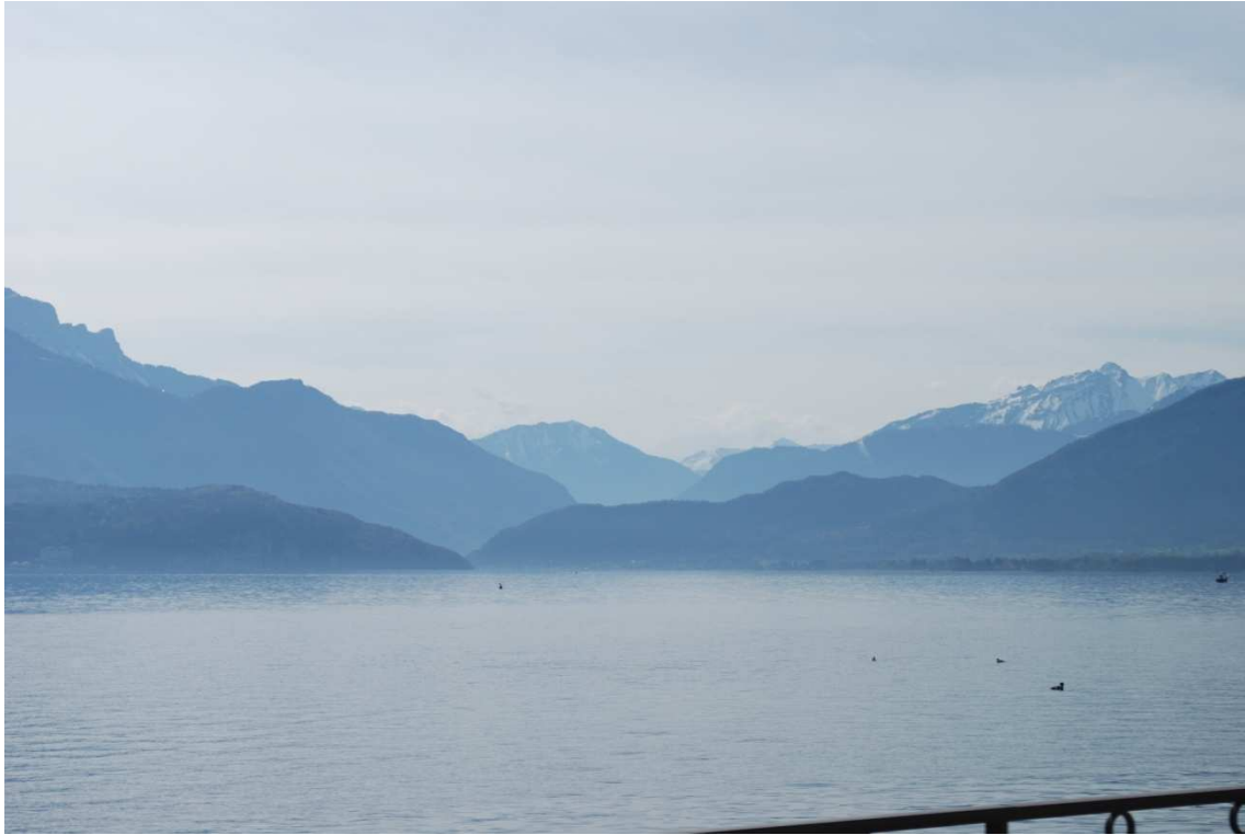
Annecy, Lago

Por la mañana después de desayunar y sacar al perro nos marchamos para Carcassonne con mucho dolor de corazón por no poder haber visto Annecy, nos queda el consuelo de que este verano volveremos a pasar por aquí y esperemos que haya más suerte esta vez.