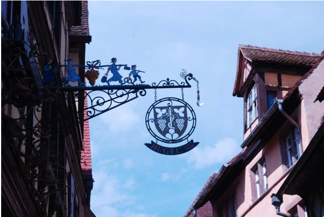
Riquewihr, detalle de una casa

Terminada la visita y dado que es pronto nos marchamos para Riquewihr 5,9 Km, este pueblo ha salvado sus casas y murallas milagrosamente de todas las guerras y todas las demoliciones con lo que se conserva con el mismo aspecto del siglo XVI. Está lleno de animación, los alsacianos celebran la Pascua de manera distinta a nosotros, decoran sus casas con huevos de Pascua y conejitos; Llevábamos información escrita de todos los pueblos que íbamos a visitar, lo que nos vino de perlas, pues la Oficina de Turismo estaba cerrada.