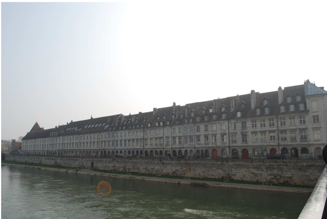
Orilla derecha del Doubs desde el puente de Battan   Foto Ana

La Catedral es peque na pero coqueta, Ana y Sara se fueron despu es de comer a ver el reloj astron mico de la Catedral al volver diversidad de opiniones, magnifico para Sara y "bueno yo me esperaba otra cosa" para Ana, yo me qued e lavando la vajilla y colocando la auto para continuar camino de Eguisheim; el parquin es gratuito por ser domingos pero bastante jodido para salir pues la curva no daba radio para la ac, en fin que salimos con dificultad pero salvando los muebles.