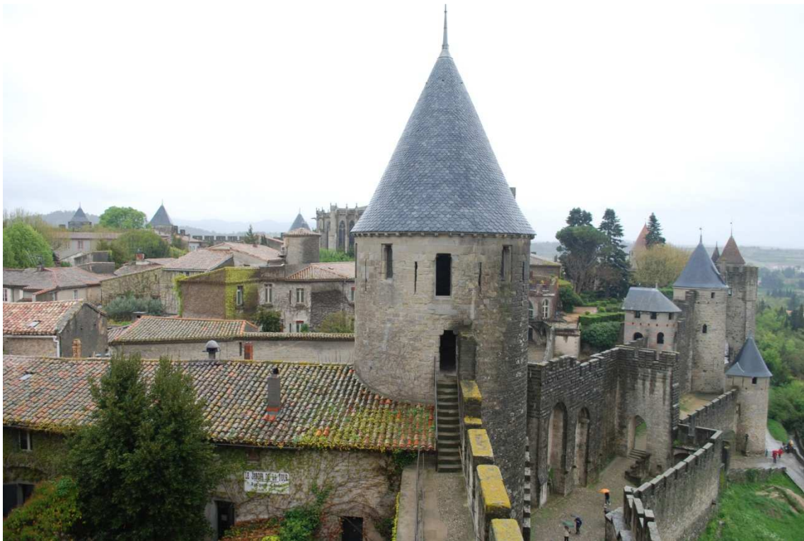
Carcassonne, La Cité

mejor que ponerse a cubierto, la segunda es imposible con la lluvia y decidimos marcharnos para Lérida, nuestro último destino antes de Getafe.