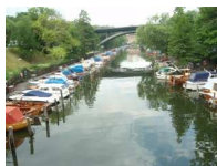
Puerto junto al área

pasamos una tarde muy agradable viendo Gamla Stan , charlando con ella. Nos encontramos con su familia ya devuelta hacia el área, que paseaban en bicicleta.