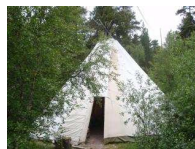
La tienda Sami