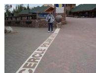
Hapapiiri ( C. P.A )