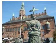
Plaza del Ayuntamiento

A partir de esa hora, y hasta 05:00, se coge otro autobús (nº 82) que al regreso para en RODKILDENEJ . En el autobús pone el nombre de las paradas. Cuando se llega al centro, está la plaza del Ayuntamiento; El Tivoli (siendo este el más antiguo de Europa) ; la Catedral protestante y algunas iglesias; el edificio de la Bolsa , que merece la pena verlo; el Palacio Christianbog y Amalienborg ; un cuartel de Artillería, que nos despistó para ir a ver la Sirenita metiéndonos por un laberinto (del que salimos preguntándole a una pareja, dando la casualidad de que ella era española y de Murcia ¡casi nada! casada con un Danés); y por fin, la Sirenita . Al irnos vimos la fuente GEFION , ¡preciosa!