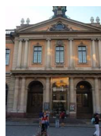
Edificio de los premios Nobel

Realizaron el cambio de guardia a las doce de la mañana. ¡Una parafernalia que merece la pena ver! Sacamos los billetes para el barco que va a la Isla Djurgarden . Visitamos el museo Vasa para ver en su interior el buque de guerra “ Real Vasa ” que se hundió el día 10 de Agosto 1.628 en el puerto de Estocolmo , a sólo cien metros del punto más meridional de Djurgarden . Tras una compleja operación de rescate del buque hundido, los sacaron íntegro del fondo marino. Proyectaron una película en español sobre la operación de rescate (merece la pena verlo). Cuando salimos del museo nos encontramos con la sorpresa de que el embarcadero estaba cerrado, no cumpliendo