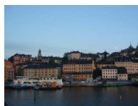
Vista de Estocolmo