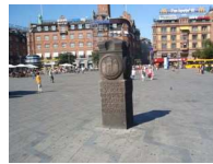
Plaza del Ayuntamiento

Camping Bellahoj C/Huidkildevej 66 CP-2400 Kobenhavn (Dinamarca) Coordenadas N 55° 42'00'' E 12° 30'39'' . Nos quedamos a descansar un poquito haciendo la colada, comimos temprano y salimos para KOBENHAVN . La intención era visitarlo casi todo por el exterior y rápido. Tenemos billetes de autobús que nos ha regalado una amiga danesa, cogimos el número 2-A en la parada Hulgardsvej , el recorrido te deja en Rhadmuspladsen (plaza del Ayuntamiento ). Este autobús regresa al camping hasta las 00:00 horas.