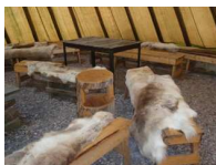
Por dentro de la tienda

El camping N-69.46856° E-25.48801° es uno de los mejores en que hemos estado. Tiene unas saunas Finlandesas y casas de madera muy concurridas. Lo más llamativo fue una tienda de los Samis , en su interior tiene una hoguera en el centro, y alrededor unos bancos de madera, y sobre estos pieles de reno. Una vez instalados pasamos por recepción y compramos una ficha para lavar y secar ropa. Se puede conectar a Internet 24 horas pagando 24 Coronas. Por la tarde salimos a dar un paseo para visitar el Parlamento Sami situado a unos 300 o 400 metros del Camping.