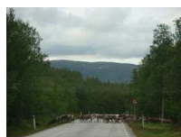
Paso de Renos