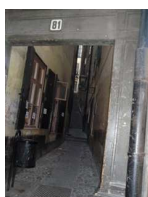
Marten Trotzigs Grand

Riddarhuset (casa de la Nobleza de estilo barroco Holandés ); Vasterlanggatan , calle más comercial; Marten Trotzigs Grand 81 (calle más estrecha de la ciudad con 90 cm de ancha); Storkyrkan (catedral) y por fin llegamos a Kungliga Slottet (Palacio Real) , Plaza Stortorget encontrándose el edificio donde entregan los premios Nobel