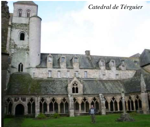
Catedral de Treguier

Nos fuimos hacia Paimpol para visitar el Pnte. De l'Arcouest . Hay aparcamientos con barreras para limitar la entrada de AC, pero el último aparcamiento habían quitado la barra superior y allí estaban todas las AC, al lado mismo del mar, donde los franceses se iban a recoger los mariscos para la comida.