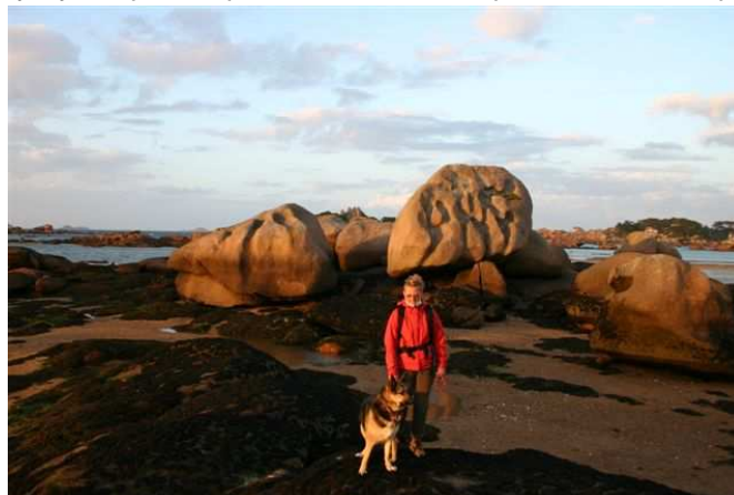
Costa de Granito con la marea baja