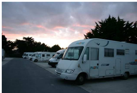
Área de Trégastel