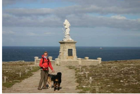
Pointe du Raz

pasamos sin ningún problema, yo creo que las ponen para personas que tienen algo de vértigo, vale la pena llegar hasta el final.