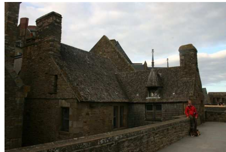
Le Mont Saint Michel

De aquí de una tirada, hicimos el regreso por Clermon-Ferran, Millau, Beziers, Perpignan y Barcelona. Esta autopista es gratuita, (con excepción del puente de Millau), el paisaje es precioso, pero la autopista se las trae, pues todo el rato va subiendo hasta 1100 mts. de altura, para ir bajando y subiendo de manera continuada, yo no pienso pasar nunca más.