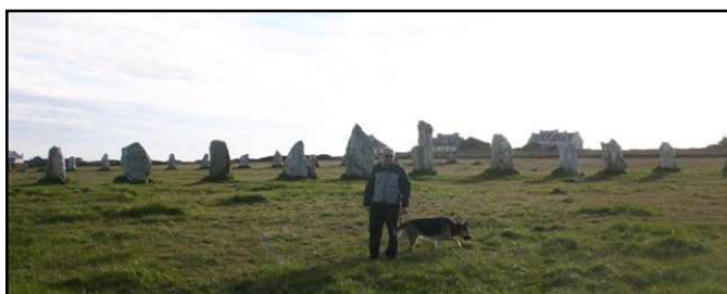
Campo con menirs