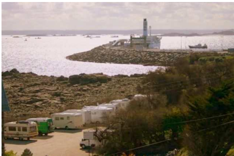
Área de Roscoff