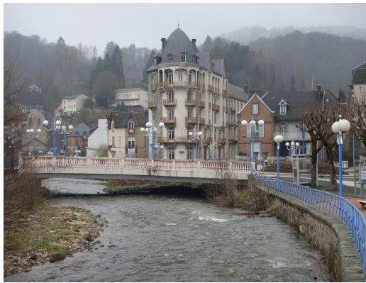
La Bourboule (Vista general)

Podemos admirar Les Grans Thermes, Le Casino, L'Eglise Saint-Joseph, etc. Esta estación termal debe su fama a la calidad de sus aguas y a la pureza del aire que aquí se respira. Está construida entorno a las fuentes y siguiendo los márgenes del Dordoña, en la base del macizo montañoso del Sancy.