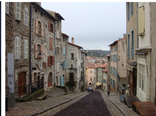
Le Puy en Velay (Rue de Tables)

Aunque dispone de ACC GPS 45° 2'30'' N 3° 53'0'' E , ya que veníamos limpios y cargados de agua optamos por estacionar y pernoctar en uno de los PK que están muy céntricos, junto al casco viejo, a menos de 100 m.