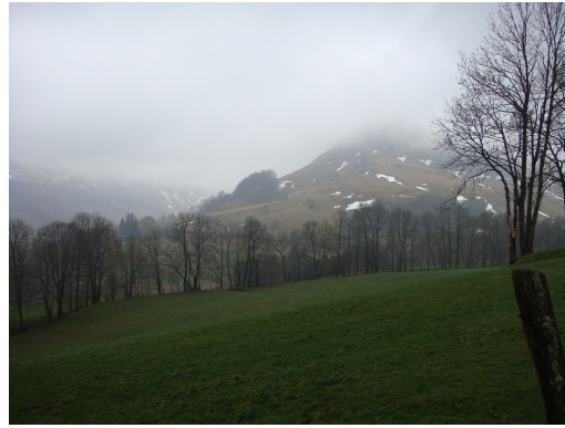
Le Puy Mary

Es un lugar único del Macizo de Cantal, que es el mas grande macizo volcánico de Europa, con sus 12 valles glaciares dispuestos en forma de estrella alrededor del Puy-Mary. Con una altura máxima de 1.857 m. esta montaña , gracias a su situación estratégica en el centro del Parque Natural Regional de los Volcanes de Auvergne, ofrece un panorama inolvidable.