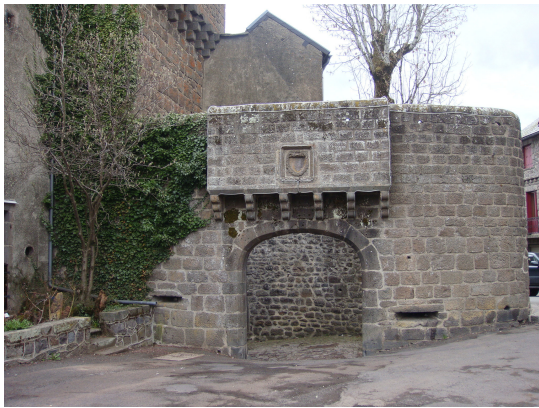
Besse (Entrada Burgo Medieval)

Volvemos a Mont-Doré y tomamos dirección Besse por la D-996 pero antes nos desviamos por la comarcal D-27 para visitar Orcival y su Basílica de Nôtre-Dame. Esta importante iglesia románica, antigua iglesia abacial benedictina, fue construida en el siglo XII por los monjes de la Abadía de la Chaise-Dieu.