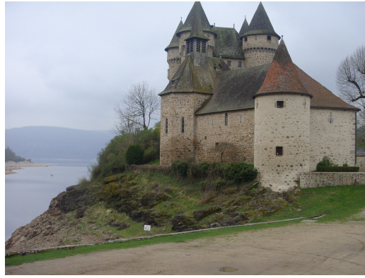
Chateau du Val (Lac Rousillon)

Ya estamos en La Bourboule , a 850 m. de altitud, se extiende a lo largo del río la Dordogne jalonada por una docena de puentes, algunos pintados de color de rosa.