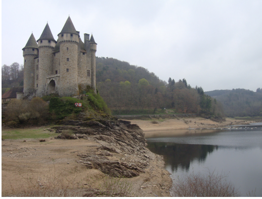
Chateau du Val