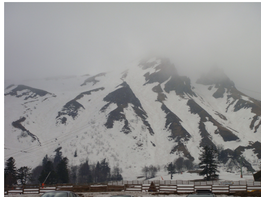
Le Puy Sancy

Puy-Sancy es el punto más alto del Macizo Central, 1886 m. Este macizo de marcado relieve, es el resultado de una intensa actividad de la corteza terrestre que ocurrió hace alrededor de 4,5 millones de años; 250.000 años atrás fue la mas colosal erupción que tuvo la Auvernia. Este enorme volcán se derrumbó y se elevó y las capas de piedra volcánica cubrieron una superficie de 100 km 2 . Su base está salpicada de lagos de cráter.