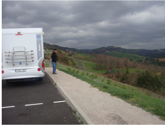
A-75 Mirador Marvelojis

Y ya estamos en Carcassonne ..... con la ciudad medieval fortificada La Cité , no hay palabras para describir su grandiosidad. Recomendable visitarla después de la hora de cerrar las tiendas o mejor aún por la mañana temprano, antes de que sus estrechas calles se llenen de gente.