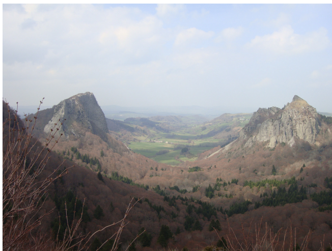
Rocas Tuilèrie y Sanadoire

Pocos Km. después el Lago Chambon , en Chambon sur Lac.