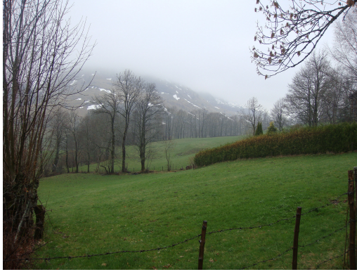
Le Puy Mary