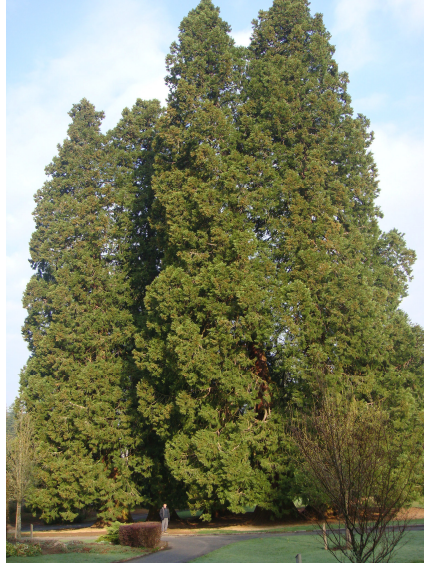
Sequoias (Parque Fenesterre)

Aparcamos en el centro y después fuimos a pernoctar al ACC, situada a 1 Km. dotada de vaciado WC, aguas grises y borne Raclet para llenado de agua limpia, 2 € por 100 l. Coordenadas 45.58957° N 2.75018° E