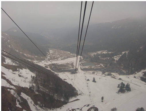
Le Puy Sancy

Subimos 3 km. para llegar al teleférico de Puy-Sancy .