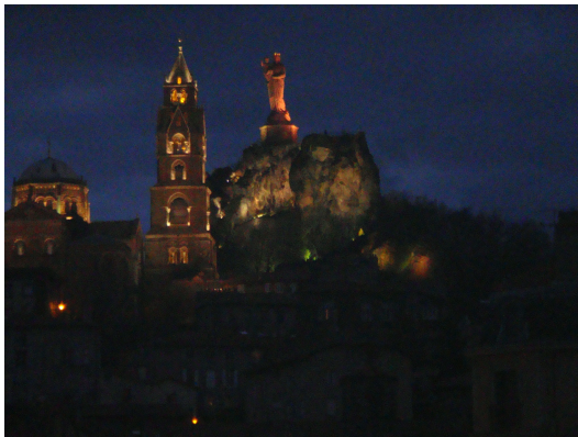
Le Puy en Velay

Llegamos a Le Puy-en-Velay ., hay que calzarse zapatos cómodos, ya que las calles del casco viejo están todas empedradas y para ver bien la ciudad hay que andar bastante y todo son subidas, bajadas y muchas escaleras.