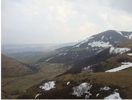
Volcanes valle Cezalier