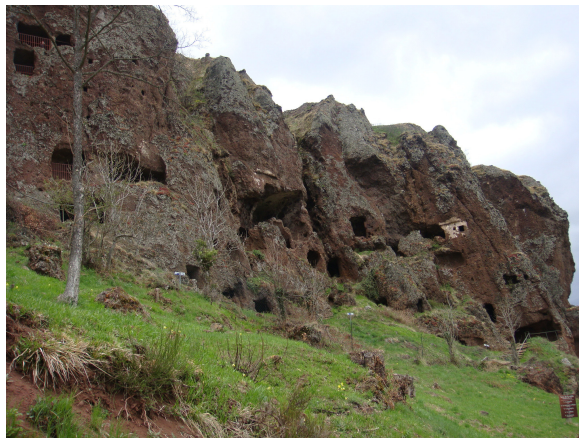
Gruta de Jonàs

A 10 Km. está la Gruta de Jonàs, que es una cueva habitada desde la prehistoria, decidimos visitarla, interesante de ver pero que no compensa por la muy estrecha carretera de curvas, pese a que para AC y Buses está previsto este desvío que te obliga a realizar 30 Km. más , lástima no haberlo sabido antes y haber ganado unas horas.