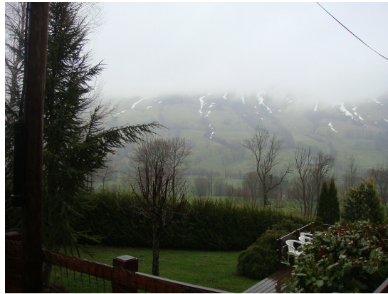
Col du Pas du Peyrol

Estamos en el Col du Pas de Peyrol, a 1588 m.