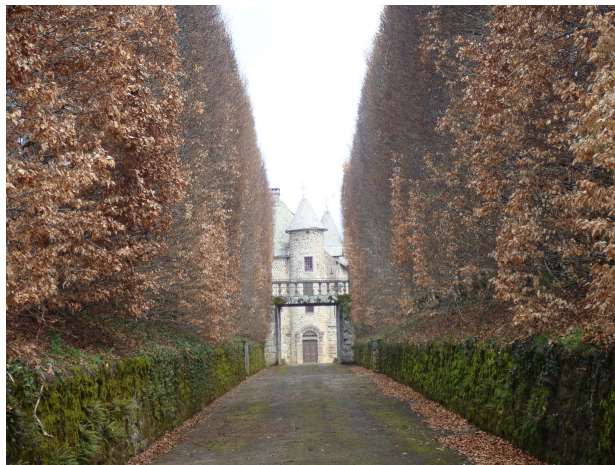
Chateau du Chaldes

A 1,5 Km. se encuentra el castillo de Chaldes que no pudimos visitar porque se encontraba cerrado.