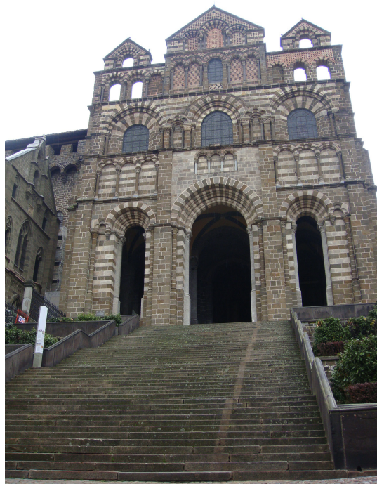
Le Puy en Velay (Catedral)

Por una tarde, un día completo y dos noches abonamos en parkímetro 6,90 €, precio que me parece compensa los desplazamientos al centro, proximidad a los monumentos, restaurantes y comercios