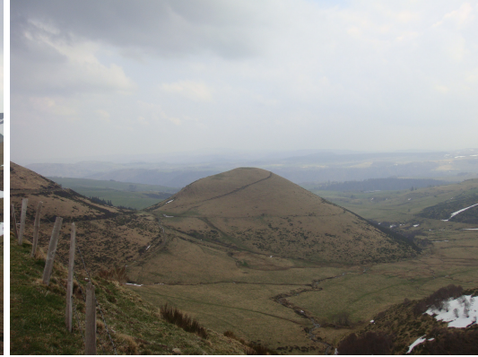
Volcanes valle Cezalier

En la cima se pueden ver y visitar las ruinas del Templo de Mercurio. El Puy-de-Dôme fue un lugar de culto mayor en la antigüedad, desde cuya cima Mercurio, el dios alado, despegaba. También esta cima inquietó mucho, en la Edad Media: pensaban que las brujas celebraban allí sus aquelarres.