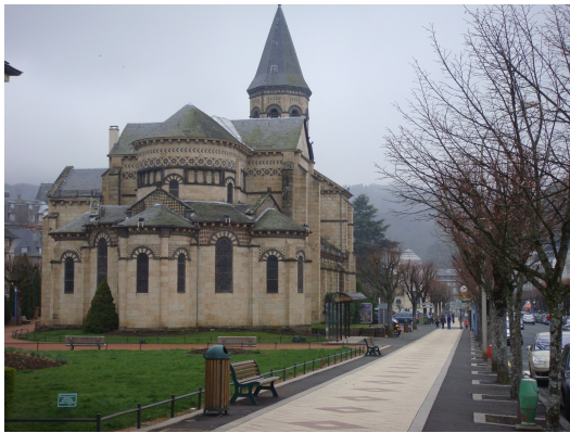
La Bourboule (Iglesia San José)

Esta ciudad ha sabido conservar la belleza de la "Belle Époque" cuidando los edificios antiguos como si fueran recién construidos.