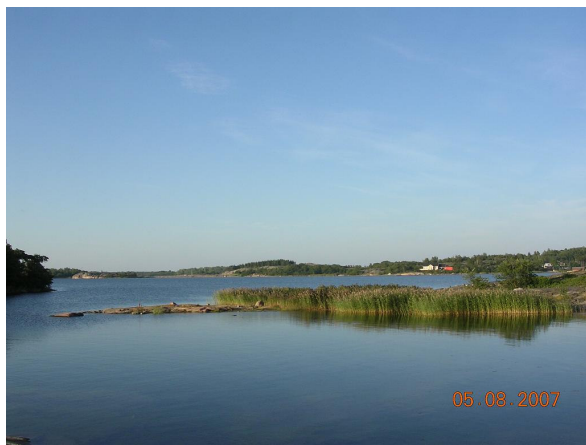
Archipiélago de Aland