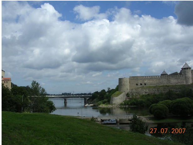
Fortaleza de Rusia (Estonia)