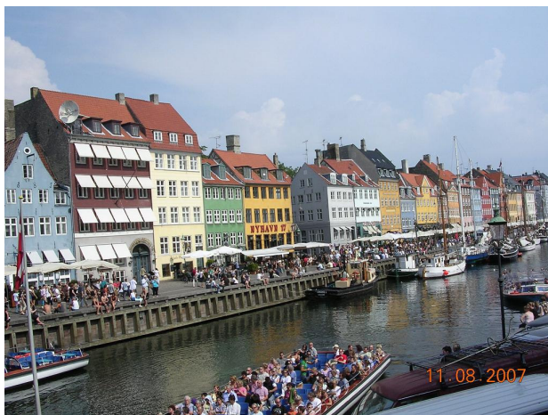
Puerto de Nyhavn (Copenhague)

Y al lado del mar, llegamos al parking de ACs , dándonos unas duchas en las casetas móviles que tienen y que están bastante bien, aunque a mí me toca una sin luz.