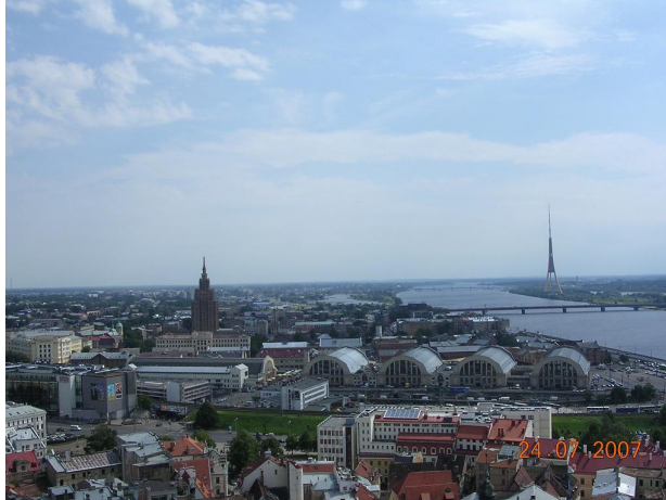
Hangares de Riga (Letonia)

Entramos en la catedral a ver el enorme órgano que tiene, pero está reparándose y los tubos están desmontados. Comemos en un McDonalds. Luego orbaya y entramos en unas galerías donde nos compramos un helado de chocolate exquisito. Tienen fama. Nos parece una ciudad más cara que las anteriores. Volviendo al camping pasamos cerca del río a muchos autobuses españoles del 40 aniversario IFA.