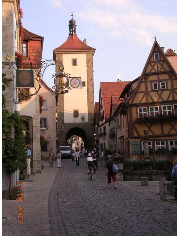
Rothenburg ob der Tauber (Alemania)