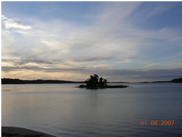
Archipiélago de Turku