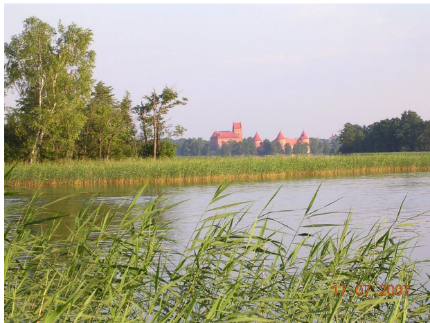
Castillo de Trakai (Lituania)

baña en el bello lago, con el castillo de Trakai al fondo. Precioso. El resto estamos agobiados con los mosquitos. Llegar al camping no fue tarea fácil. El TT ya no funciona en las bálticas y, aunque no nos equivocamos, hubo que acceder por carreteras de tercer orden aunque no bacheadas.