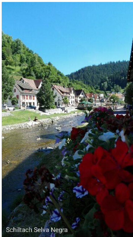
Schiltash Selva Negra

En Baden Baden y en otras ciudades alemanas, se puede comprar un billete de transporte de grupo para todo el día, que sale más barato que el billete de ida y vuelta individual, en el caso de tres personas, si el grupo es más grande, la ventaja es mayor.