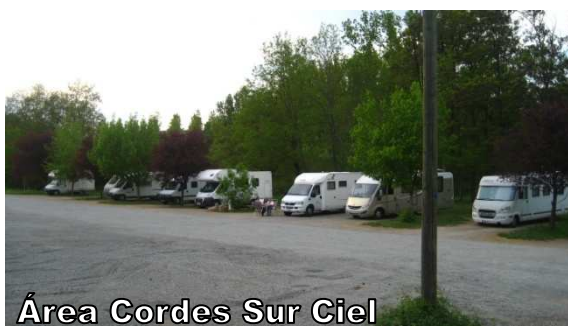
Área Cordes Sur Ciel

Área Albi que he visto nunca, sobre todo por su originalidad en todos los aspectos). Vimos los jardines que había al lado y también