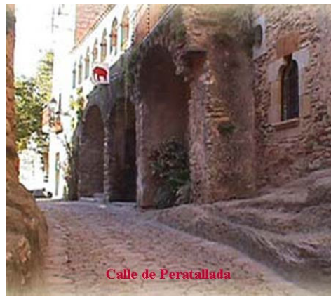
Calle de Peratallada